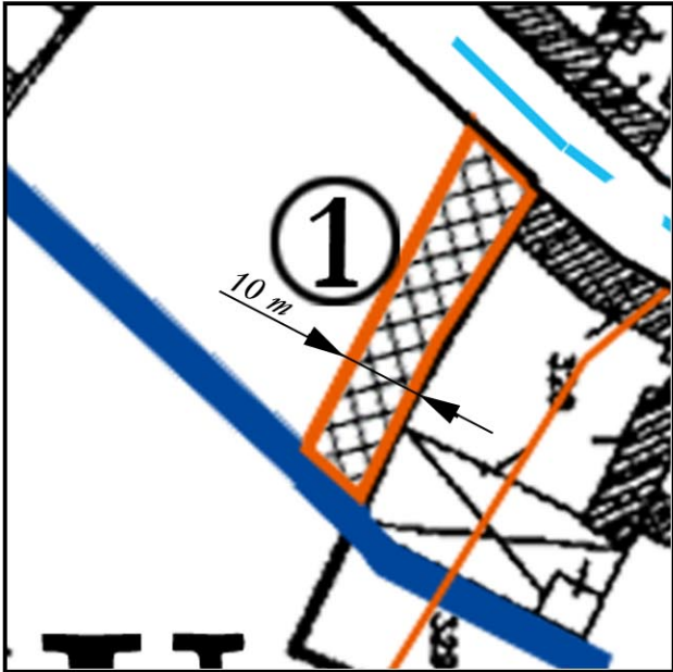
1: Rue de Cuvilly